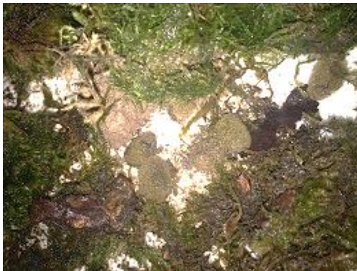
شکل ۱- پیله‌گذاری زالوها در بسترهای مصنوعی استفاده شده. Figure 1- Cocooning of leeches in artificial substrates.

برای انجام این پژوهش، تعداد ۱۲۰ قطعه زالوی شرقی پیش مولد از مرکز تکثیر و پرورش زالو در منطقه جویبار خریداری و به سالن آکواریوم دانشگاه علوم کشاورزی و منابع طبیعی ساری منتقل شد. برای سازگاری با شرایط جدید قبل از انجام آزمایش، به مدت دو هفته نگهداری شدند. در این آزمایش ۴ گروه آزمایشی مختلف خون شامل اسب، گاو، گوسفند و مرغ در ۳ تکرار در قالب طرح کاملاً تصادفی استفاده شده و در هر تکرار ۱۰ قطعه زالوی شرقی پیش مولد قرار داده شد. دمای سالن آزمایش حدود ۲۵ درجه سانتیگراد ثابت بوده و در شرایط تاریکی زالوها پرورش داده شدند و فقط زمان غذادهی در شرایط نور انجام شد. میزان حجم آب به ازای هر قطعه زالو حدود ۲ لیتر بوده که هر ۵ تا ۷ روز یکبار به طور کامل تعویض شد. میزان غذادهی به ازای هر زالو، ۱۰ سی سی از گروه‌های آزمایشی بوده است که کل حجم خونی مورد نیاز بسته به تعداد زالو در هر تکرار درون دستکش‌های لاتکس ریخته و درون آکواریوم‌ها قرار داده شد. بعد از تغذیه پیش مولدین، بسترهای مصنوعی مشکل از خزها درون هر آکواریوم با همان تراکم اولیه زالوها آماده شد (شکل ۱). خزهای جمع‌آوری شده از روی درختان جنگلی را با حجم پوششی کاملاً یکسان درون آکواریوم‌ها قرار داده شد.