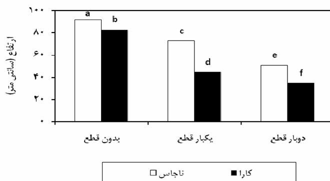
نمودار ۱: اثر قطع کردن بر ارتفاع گونه‌های آزمایشی

بر اساس داده‌های حاصل از میانگین ارتفاع گیاهان آزمایشی در تیمار شاهد (بدون قطع)، ارتفاع Chara در تیمار یک‌بار و دوبار قطع نسبت به شاهد به ترتیب ۴۳/۷۵ و ۶۸/۷۵ درصد کاهش داشته است.