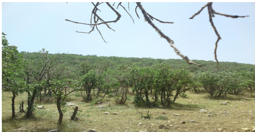
شکل ۱: نمایی از یکی از قطعات جنگلی مورد مطالعه

مهم‌ترین مطالعاتی که در خارج از کشور در خصوص اثر قطعه قطعه شدن بر روی تغییرات ترکیب و پراکنش تاکسون‌های گیاهی صورت گرفته است می‌توان به بررسی غنای گونه‌های چوبی قطعات جنگل در ارتفاعات Chiapas (مکزیک)