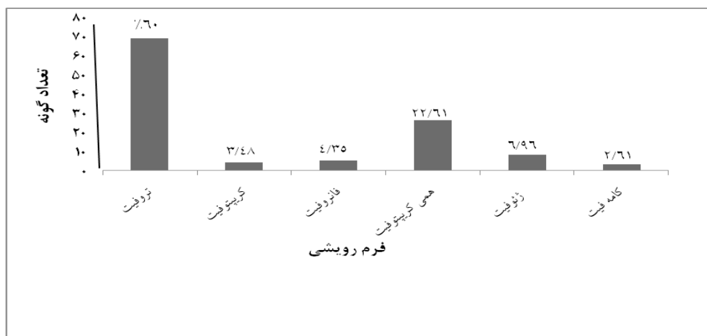
شکل ۳: طیف زیستی گیاهان منطقه مورد مطالعه براساس طبقه‌بندی رانکایر (درصد افراد هر فرم رویشی بر روی نمودارهای میله‌ای نشان داده شده است)