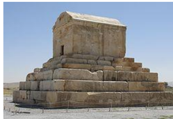
شکل ۱- آرامگاه کوروش کبیر در منطقه پاسارگاد

پاسارگاد در دشتی مرتفع به ارتفاع ۱۹۰۰ متر از سطح دریا، در حصار کوهستان واقع شده است. شهر باستانی پاسارگاد در استان فارس قرار دارد. محوطه اصلی توسط یک منطقه طبیعی بزرگ احاطه شده است. مهم‌ترین اثر مجموعه پاسارگاد، بنای آرامگاه کورش است که در سال ۵۳۰ تا ۵۴۰ قبل از میلاد و از سنگ‌های آهکی سفید متمایل به زرد ساخته شده است (Hogan, 2008). این اثر در تاریخ ۲۴ شهریور ۱۳۱۰ خورشیدی ثبت ملی شده است (شکل ۱).